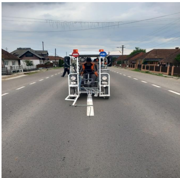
Imagini din teren de la lucrări de marcaj rutier: